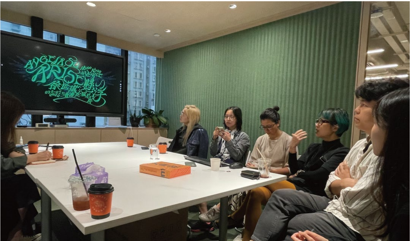
香港亚洲艺术文献库（AAA），学者们和香港艺术家们展开对谈