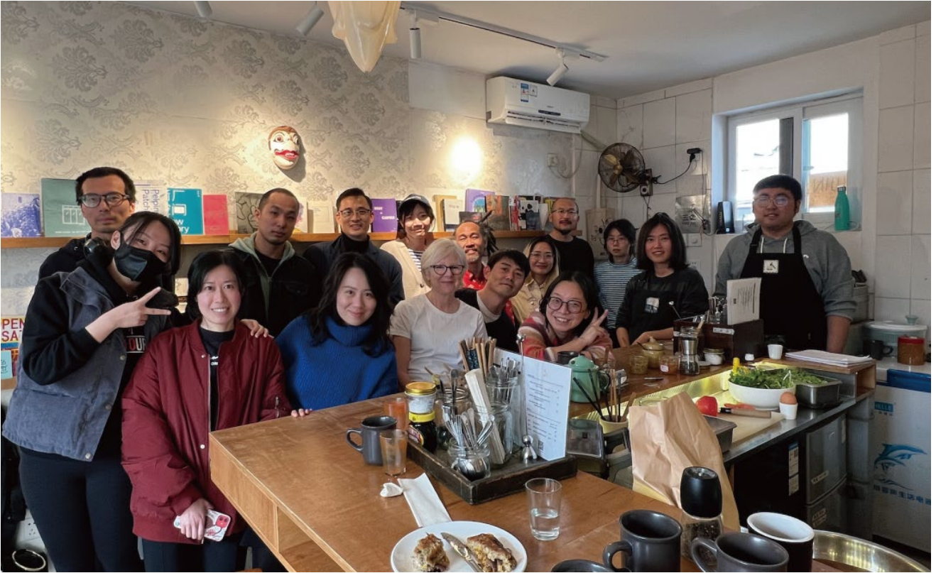
学者们与北京的同行伙伴们在五金一起享用早午餐，并展开启发性对话