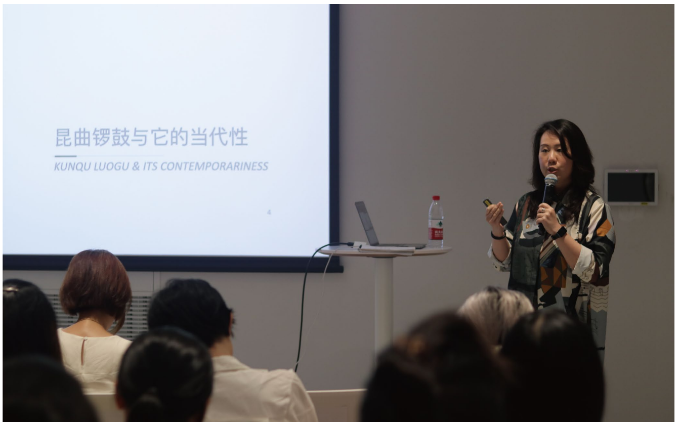
金佐宁 《错过的约会——重返声音的扩展场域》