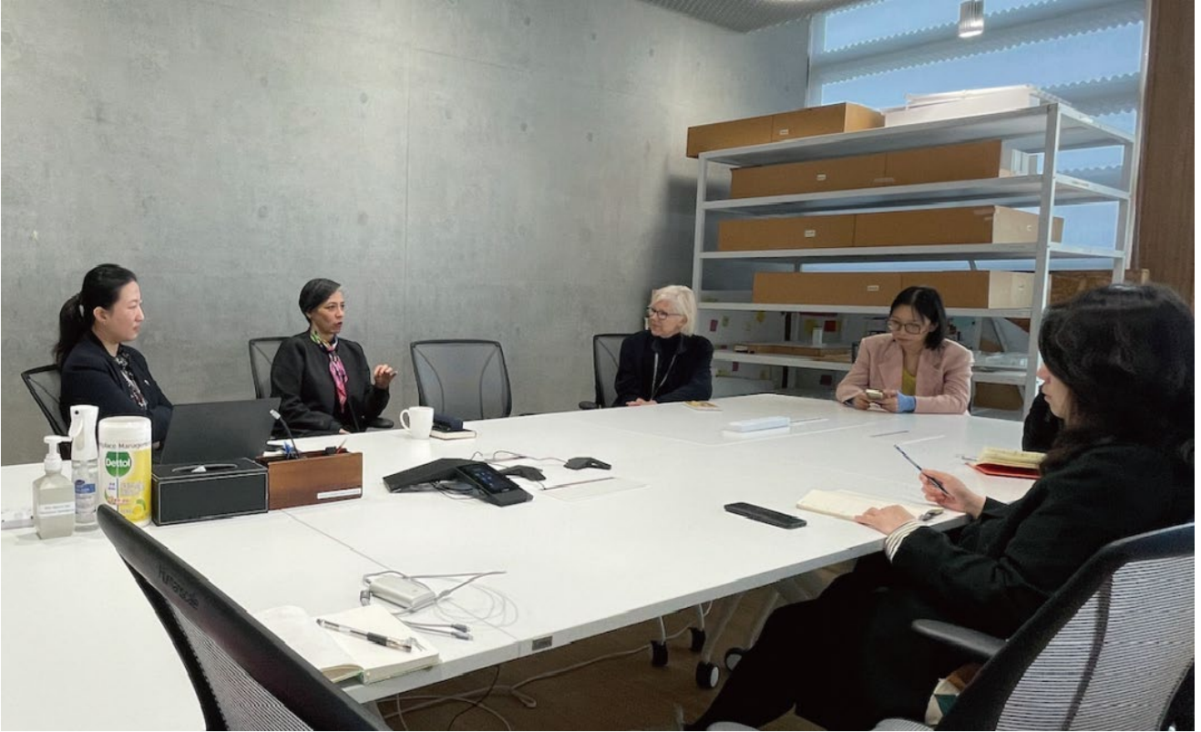
在香港M+博物馆学习