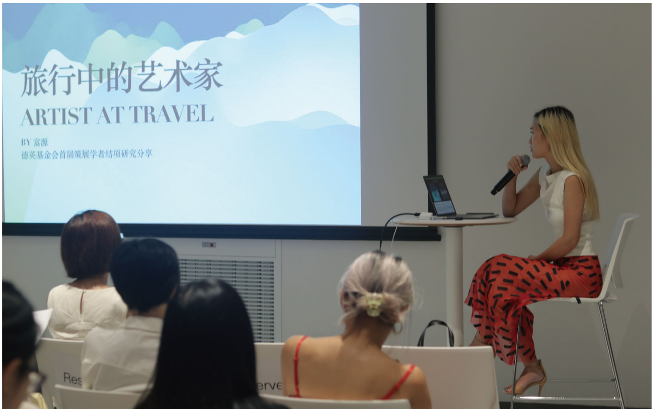
富源 《旅行中的艺术家》